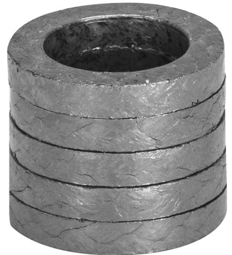
Garniture Tressée Controller 3 Evo

Controller 3 Evolution est un kit d'étanchéité composé de bagues d'étanchéité en graphite expansé Sigraflex®, certifié à faibles émissions selon les normes TA LUFT VDI2440.